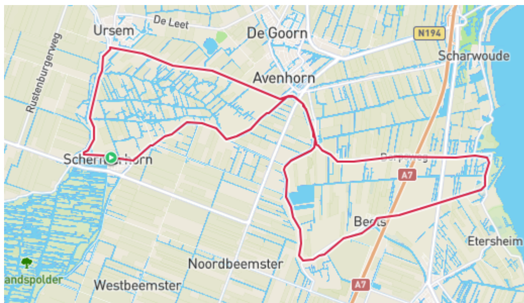
3.4 Schermerhorn Avenhorn Oudendijk

“Schermerhorn-Ursem-Avenhorn-Oudendijk -Schardam - Beets - Schermerhorn” Vanuit Schermerhorn vaar je afhankelijk van de wind rechts- of linksom (via Ursem) naar Avenhorn en daar steek je onder de weg door naar de ringvaart richting Oudendijk en ook daar kan de keuze gemaakt worden om rechts- (eerst naar Beets) of linksom (eerst naar Schardam) te varen. Deze tocht kan ook vanuit Rustenburg gevaren worden. Het rondje USA is 10km en het rondje Schardam ruim 16km samen 26km. Het rondje Oudendijk -Schardam – Beets – Oudendijk staat onder 12.4.